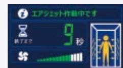
風速インジケータ付 オプション時

お問い合わせ：日立産機システム ソリューション営業統括部 クリーンエア装置営業グループ 03-4345-6025