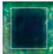
従来機 (フラッタージェットノズル)