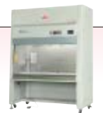
再生医療用キャビネット