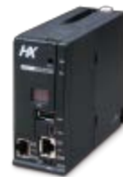
IoT対応 産業用コントローラ