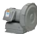
ボルテックス ブロウ