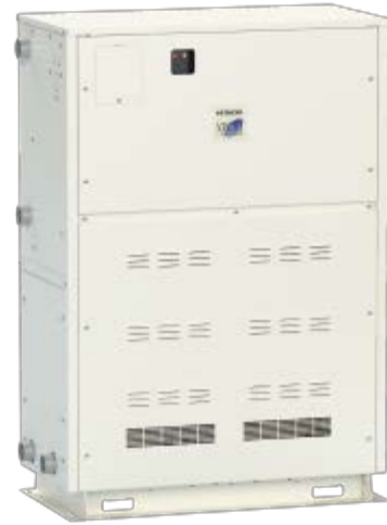
RCUNP224WV1 RCUNP300WV1 ※本機は屋内設置タイプです。