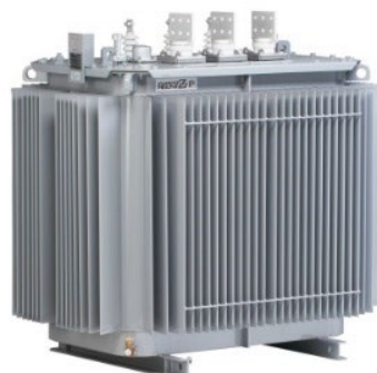
配電用油入変圧器

SUPER かなて アモルファス SUPER ero P SUPER ero S SUPER ero C