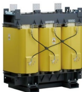
配電用モールド変圧器

SUPER かなて アモルファス SUPER ero P SUPER ero S SUPER ero C