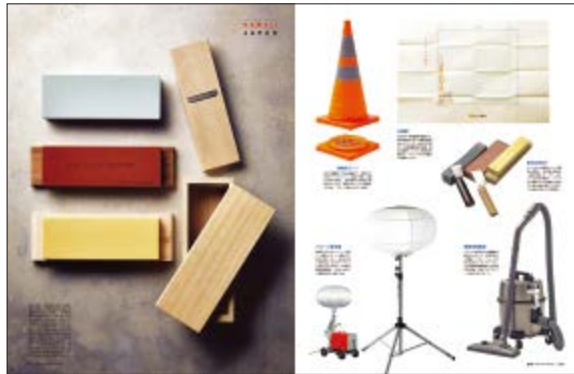
日立 業務用掃除機 CV-G95K