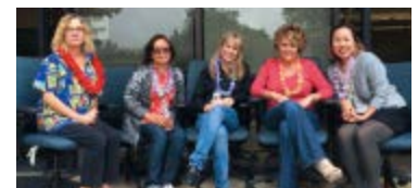
職場の仲間たちと。(右端)

北米への進出や事業拡大のお話がありましたら、ぜひお気軽にご連絡・ご相談いただければ幸いです。