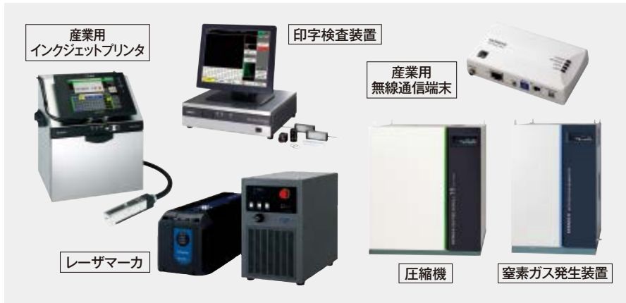
産業用 インクジェットプリンタ

アジア最大規模を誇るパッケージの総合展示会です。「産業用インクジェットプリンタ」「レーザーマーカ」「印字検査装置」「窒素ガス発生装置」「圧縮機」「産業用無線通信端末」などの出展を予定しております。ご来場お待ちしております。