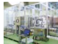
充填機の 異品種 検査システム