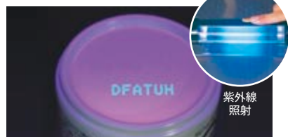
紫外線照射後(蛍光)