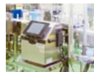
ファンケル美健様 でも導入の IJプリンタ Gravisシリーズ