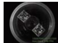
容器の底に 透明インクで印字

6/10~13開催「FOOMA JAPAN 2014」に出展します。 ※本誌P18参照