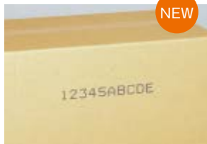
中文字用:100 \mu m機