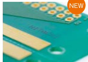
極小文字用:40 \mu m機