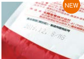
高速印字用:55 \mu m機